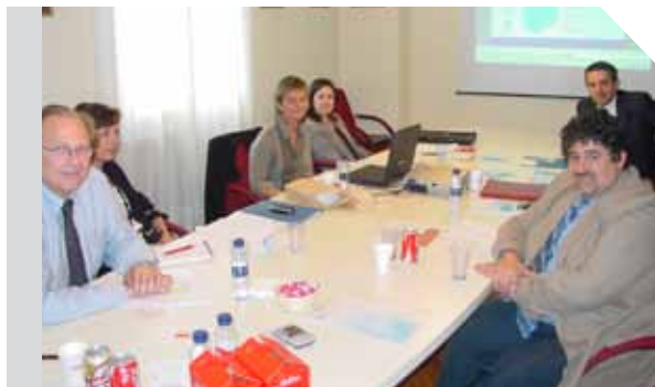
Reunión del GECP en la sede SEOM

momento previa petición de disponibilidad. ■