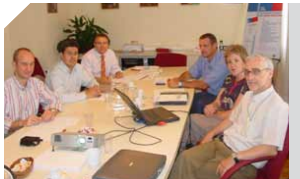
Reunión del GENOM en la sede de SEOM