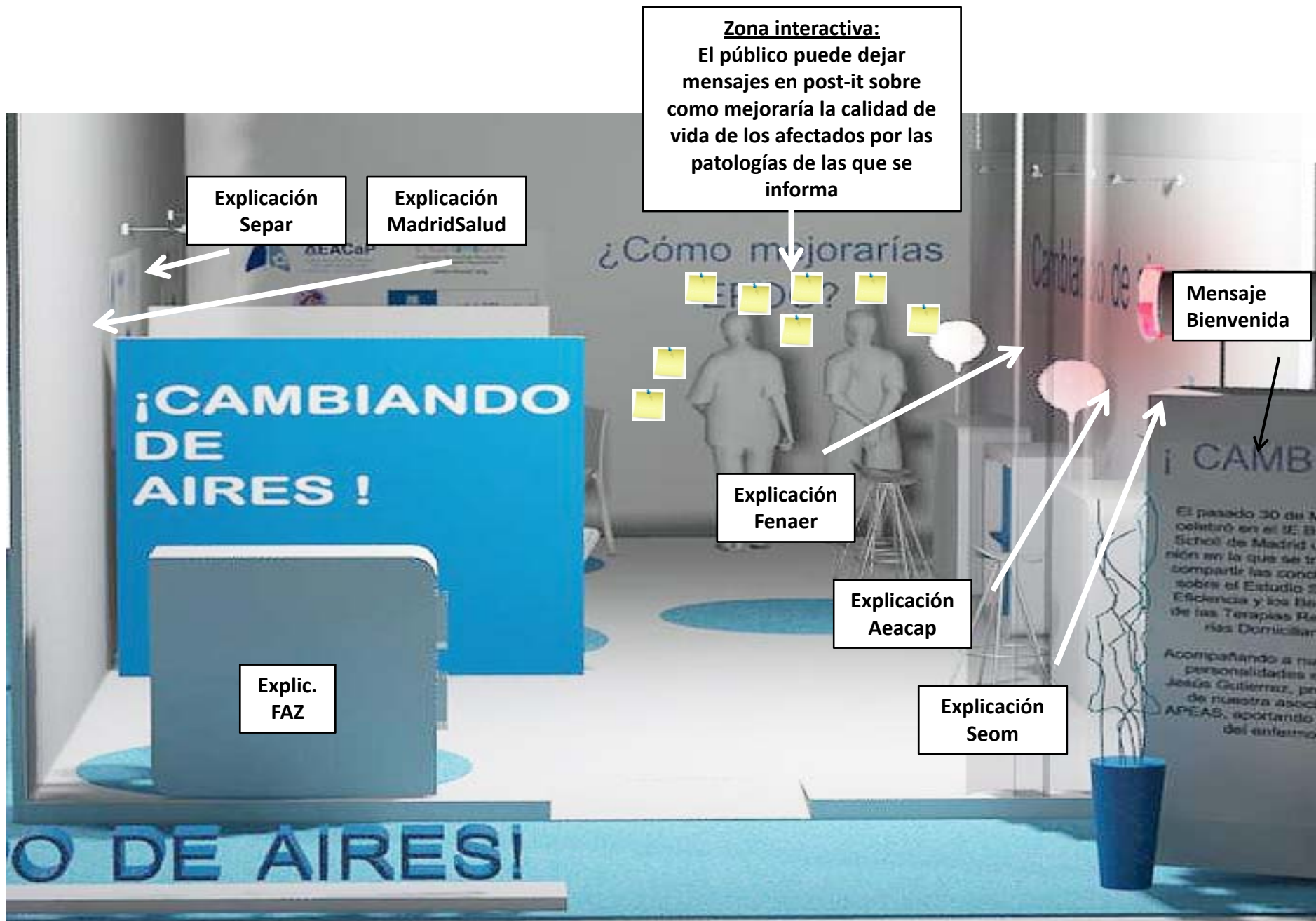
Vista interior frontal